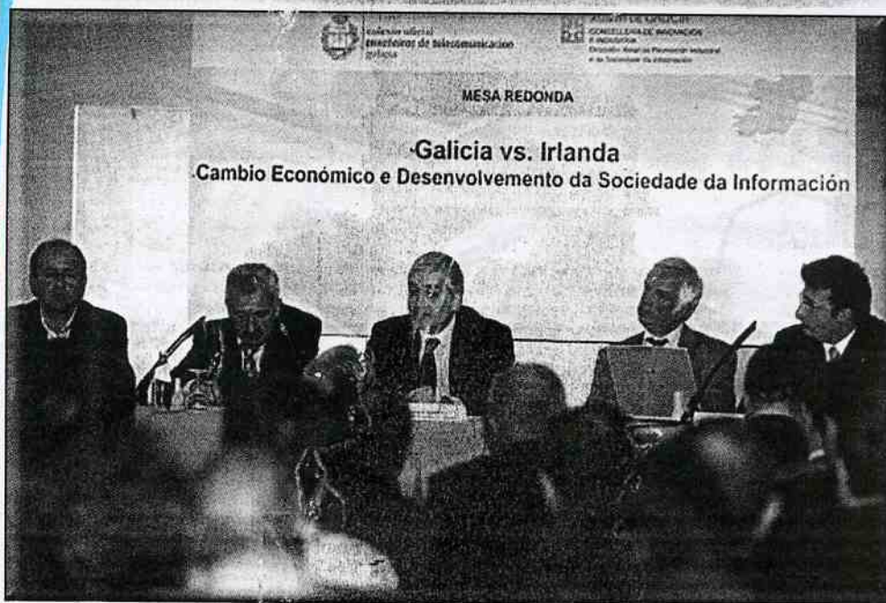
A mesa redonda organizada polo Colexio Oficial de Enxeñeiros de Telecomunicacións de Galicia.